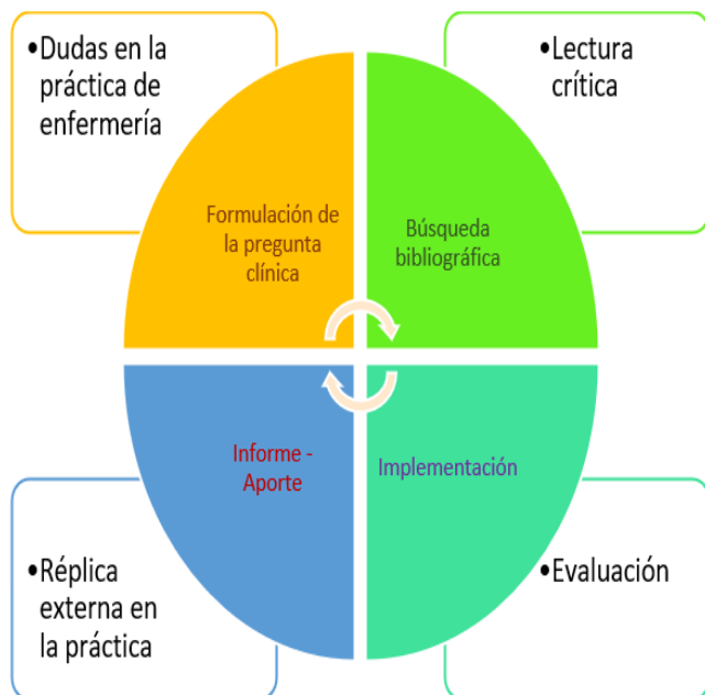
Figura 3: Fases de la EBE

Realizado por: la Investigadora. Elaboración propia.