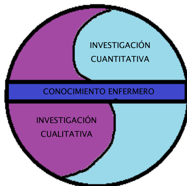
Figura N° 01. Complementariedad existente entre la investigación cuantitativa y cualitativa para generar tipos de conocimiento

Fuente: Soledad Gómez 9 Realizado por: la Investigadora