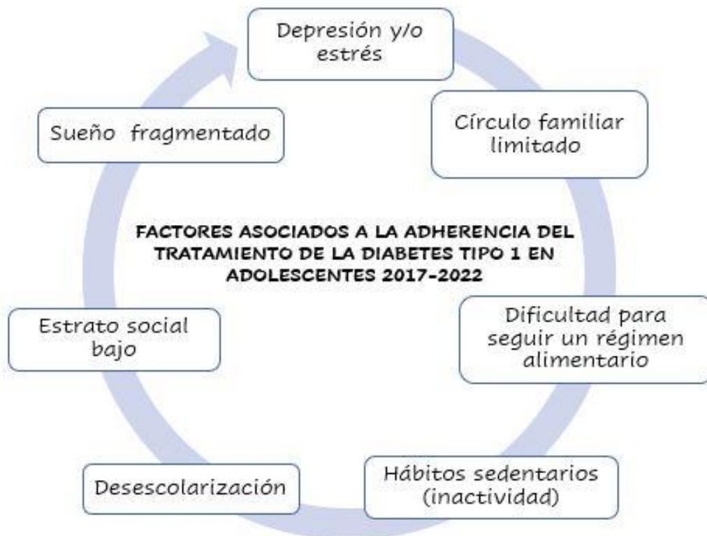
Gráfica 1. Factores asociados a la adherencia del tratamiento de la diabetes tipo 1

provocando un aumento en la resistencia a la insulina, así como también, de la proteína C-reactiva (24) .