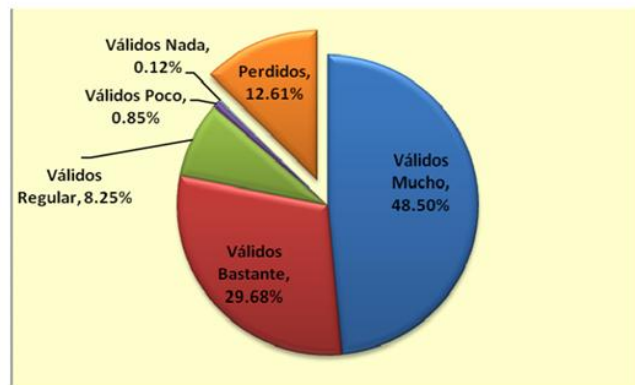
Fig 1: Usos de Internet: navegar buscando información

Como lo muestran el cuadro y el gráfico N° 01, los estudiantes encuestados utilizan Internet para navegar buscando información en un porcentaje muy alto. El 48,50% optó por “mucho” y el 29,68% por “bastante”, estas dos opciones suman el 78,17%.