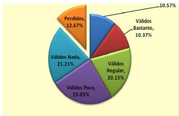
Fig 3: Usos de Internet: subir imágenes a sitio Web

Los porcentajes de uso de Internet disminuyen fuertemente cuando se analizan los datos relacionados con la incorporación de imágenes a los sitios Web de los estudiantes. En el cuadro y el gráfico n° 03 se observa que un porcentaje similar de estudiantes, alrededor de un 10.5 %, suben imágenes a su sitio web con mucha o bastante frecuencia. Sin embargo, el 21.21 % de los estudiantes encuestados nunca han subido imágenes a su sitio web, y el 25.03% realizaron pocas veces esta acción.