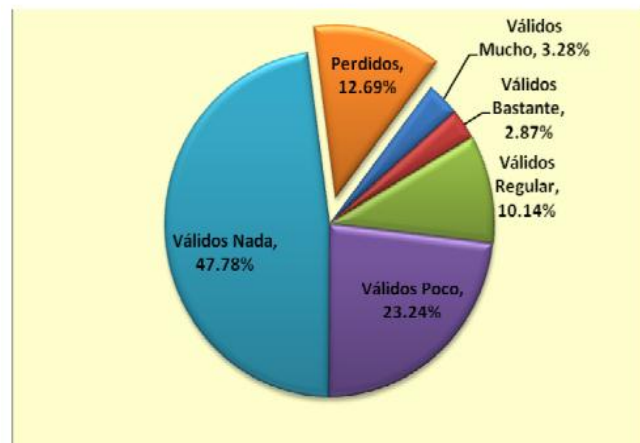
Fig 4: Usos de Internet: subir videos

Al analizar los datos relacionados con “subir videos”, se observa en el cuadro y el gráfico N° 4 que los porcentajes disminuyen significativamente si se comparan con las variables analizadas anteriormente. Los porcentajes mayores se ubican en las opciones “nada” y “poco” con un 47.78% y 23.24% respectivamente; sólo el 2,87% optaron por “bastante” y el 3,28% por “mucho”. Se observa la baja frecuencia en el uso de este medio; se puede suponer que los profesores no asignan actividades que involucren esta actividad en los estudiantes. Los videos son medios de suma importancia en el proceso de aprendizaje, ya que por su carácter audiovisual favorecen la apropiación reflexiva y consciente del contenido, en una unidad entre la instrucción, la educación y el desarrollo.