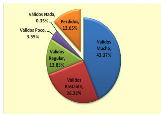
Fig 2: Usos de Internet: leer y enviar correo