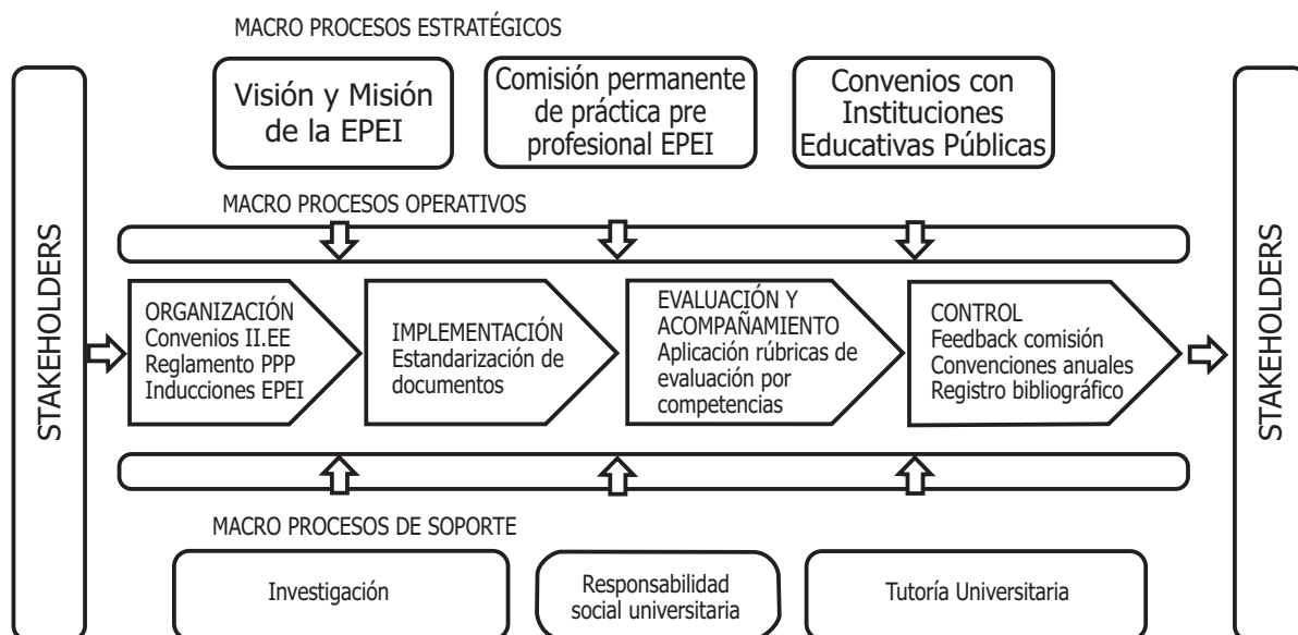
Figura 2. Mapa de procesos. Proceso misional de Práctica Pre profesional.

Nota. La figura muestra los macroprocesos estratégicos, operativos y de soporte del proceso misional de la PPP. Fuente: Norma ISO 21001 (2018).