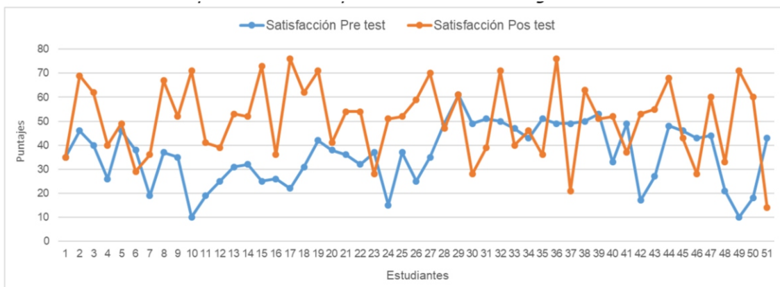
Figura 3. Resultados de la implementación del proceso misional PPP según norma ISO 21001.

Nota. La figura muestra los resultados obtenidos antes y después de la implementación del proceso misional PPP según norma ISO 21001 (2020).